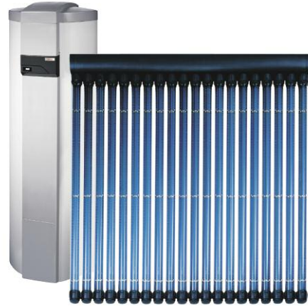
AURON® DF is een vacuümbuis zonnecollector met directe doorstroming.

De AURON® DF heeft een hoge bestendigheid en een lange levensduur. Door het zeer efficiënte gebruik van zonne-energie is het een ideale oplossing voor ons gematigde klimaat. Het systeem kan zonder probleem uitgebreid worden voor een latere montage.