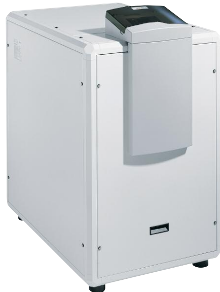
De warmtepomp AQUATOP T van ELCO.

Doordat de temperatuur in het grondwater zowat het hele jaar door constant blijft, is het grondwater ook een geschikte energiebron. Maar oppervlaktewateren, meren, rivieren en het afvalwater kunnen ook gebruikt worden als energiebronnen.