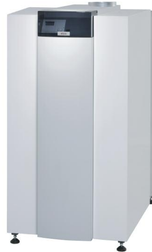
De productreeks R600 vertegenwoordigt de nieuwe generatie gascondensatieketels van RENDAMAX.