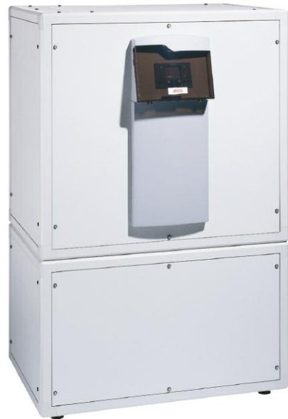
De warmtepomp AEROTOP T van ELCO.