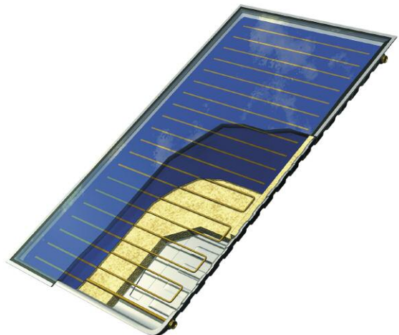
De zonnecollector SOLATRON® A 2.3 heeft een koperen absorber waardoor veel warmte wordt geabsorbeerd met een minimaal stralingsverlies.

De SOLATRON® A 2.3 wordt ook gekenmerkt door een zeer goede kwaliteit/prijs-verhouding en een hagelbescherming van klasse 3. Hij kan ook gebruikt worden om zwembadwater te verwarmen.