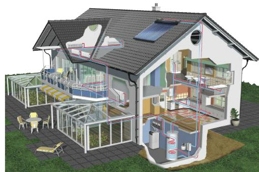
ELCO ontwikkelt volledige verwarmingsoplossingen.

Verwarmingsinstallateur, ontwerper, architect, constructeur van prefab woningen of exploitant, ELCO past zich aan en zet zich in om gepersonaliseerde relevante adviezen te geven afhankelijk van de individuele eisen.